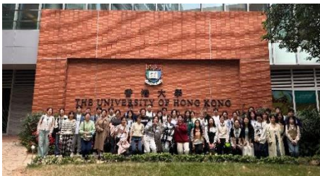
参访交流：香港大学